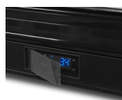
Ochranný kryt na termostat