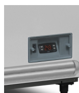
Digitální ukazatel teploty