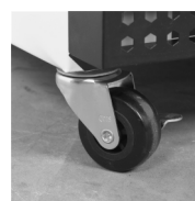
Pevná kolečka jako volitelné příslušenství