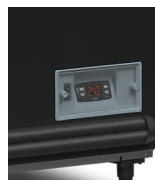
Digitální ukazatel teploty