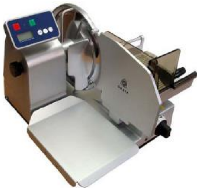
Nářezový stroj GRAEF EURO 3020 s vářící jednotkou