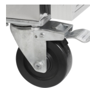
Pevná kolečka jako volitelné příslušenství