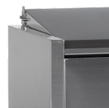
Nerezové víko na ochranu potravin