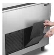
Snadné čištění filtru kondenzátoru