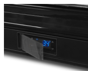
Ochranný kryt na termostat