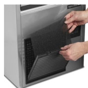
Snadné čištění filtru kondenzátoru