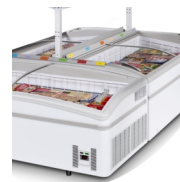
Instalace do ostrovů, police jako příslušenství

Kombinovaný mrazicí / chladicí ostrov (náhrada za NORDline UMD 1850 FR).